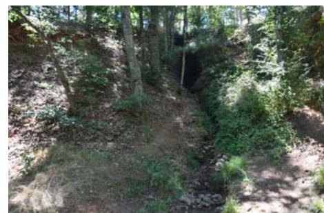
Cascada en el paraje de Monte Mario. Está completamente seca