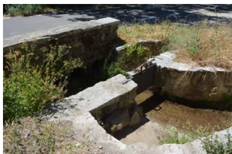
Agua en el cruce de la carretera Candelario-Navacarros

El robo de agua se denunciaba en la Foto 21 de la serie "Expolio y ruina de El Bosque", en el que también se incluían 6 fotografías como testimonio gráfico de los hechos ( http://bejar.biz/expolio-ruina-bosque-bejar-foto-denuncia-n-21-un-y ). Conviene señalar que esas fotos del pasado 7 de agosto son casi idénticas a las que se incluyeron hace dos años en una denuncia que el Grupo hizo ante el Juzgado. Aunque el Seprona nos pidió una ampliación de la información y le facilitamos copias de documentos y publicaciones nuestras, el asunto parece haberse cerrado sin más.