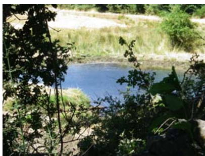
Charca alimentada con agua de la regadera de El Bosque, a la que no tiene derecho